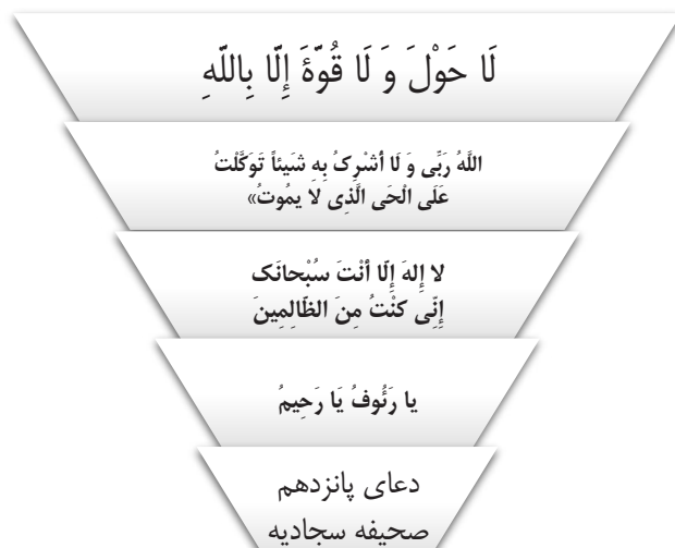
شکل ۲. ترتیب جلسات بر اساس اذکار

در ادامه سعی شد تا ترتیبی منطقی مابین اذکار و معرفت‌های استخراج شده کشف گردد که به طور خلاصه بر اساس مراتب توحید و اقسام آن (توحید ذاتی، توحید صفاتی، توحید افعالی، توحید در عبادت)، ترتیب زیر به دست آمد: